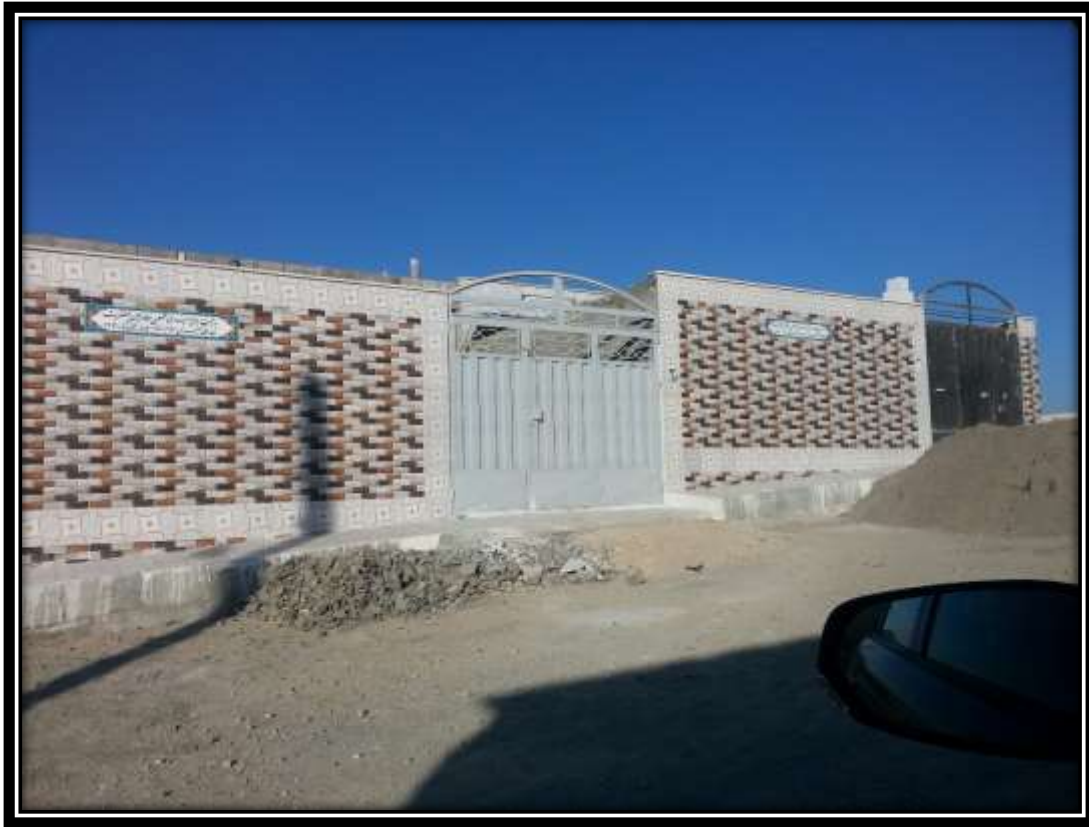
خانه های احداث شده