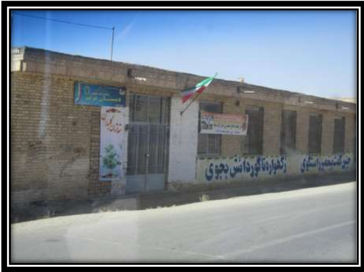
مدرسه ابتدائی نرجسیه: